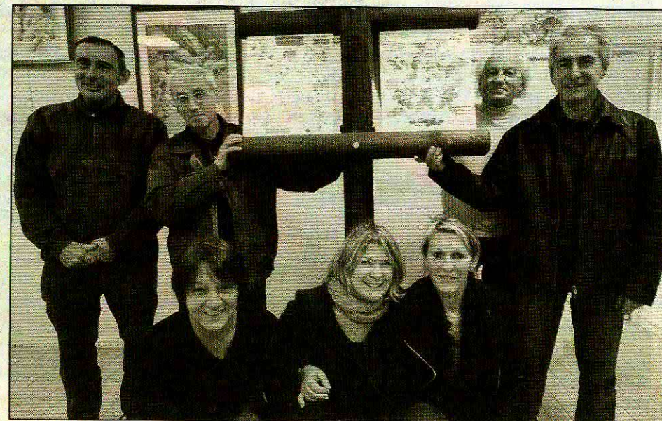
Une réalisation qui implique un partenariat étroit entre offices de tourisme, ONF, associations et communes.