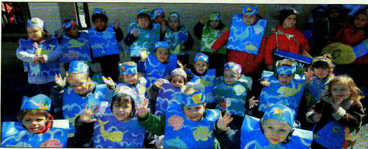
Poissons de mer, d'eau douce, ou d'avril?