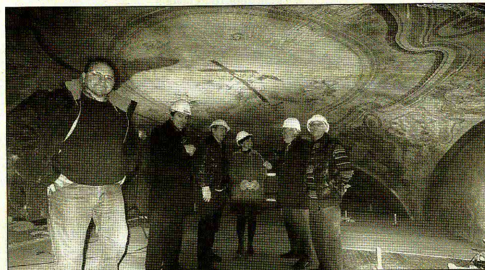
Les fresques de la voûte vont retrouver tout leur éclat et seront mises en valeur par un éclairage moderne.

L'ESCARENE Les fresques peintes de la chapelle des pénitents blancs seront mises en valeur et éclairées